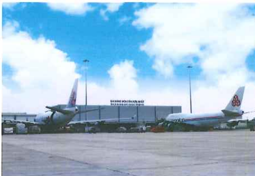
Hình 1 – Nhà ga hàng hóa quốc tế Tân Sơn Nhất

Sứ mệnh: Với mục đích thấu hiểu toàn diện, sâu sắc và cung cấp giải pháp phù hợp đáp ứng các yêu cầu dịch vụ hàng hóa hàng không của khách hàng, SCSC không ngừng phấn đấu, nâng cao kiến thức và cải tiến công nghệ hiện đại nhằm cung ứng dịch vụ với chất lượng hàng đầu và giá cả cạnh tranh.