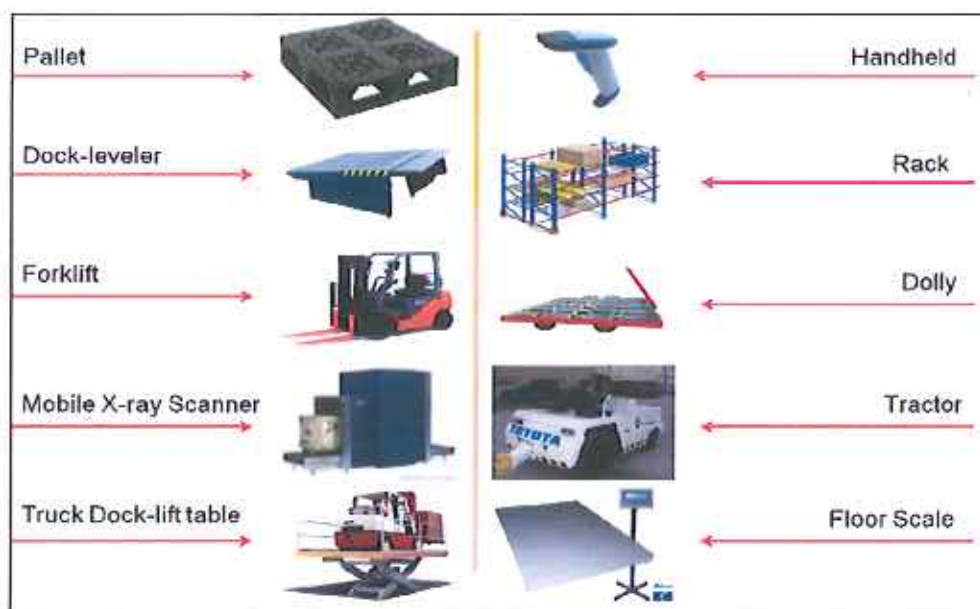
Hình 3 – Các thiết bị được trang bị phục vụ tại nhà ga hàng hóa

SCSC là doanh nghiệp được Ủy ban Nhân dân Tp. Hồ Chí Minh, Cục hàng không Việt Nam và Hải quan Việt Nam cấp phép xây dựng Nhà ga hàng hóa tại Sân bay Tân Sơn Nhất. Nhà ga hàng hóa của SCSC cũng là nhà ga duy nhất của Việt Nam phù hợp tiêu chuẩn quốc tế của IATA (Hiệp hội vận chuyển hàng không quốc tế).