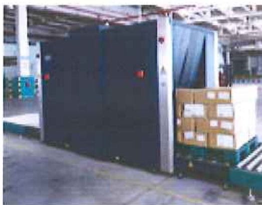
Hình 2 – Hệ thống máy soi chiếu an ninh